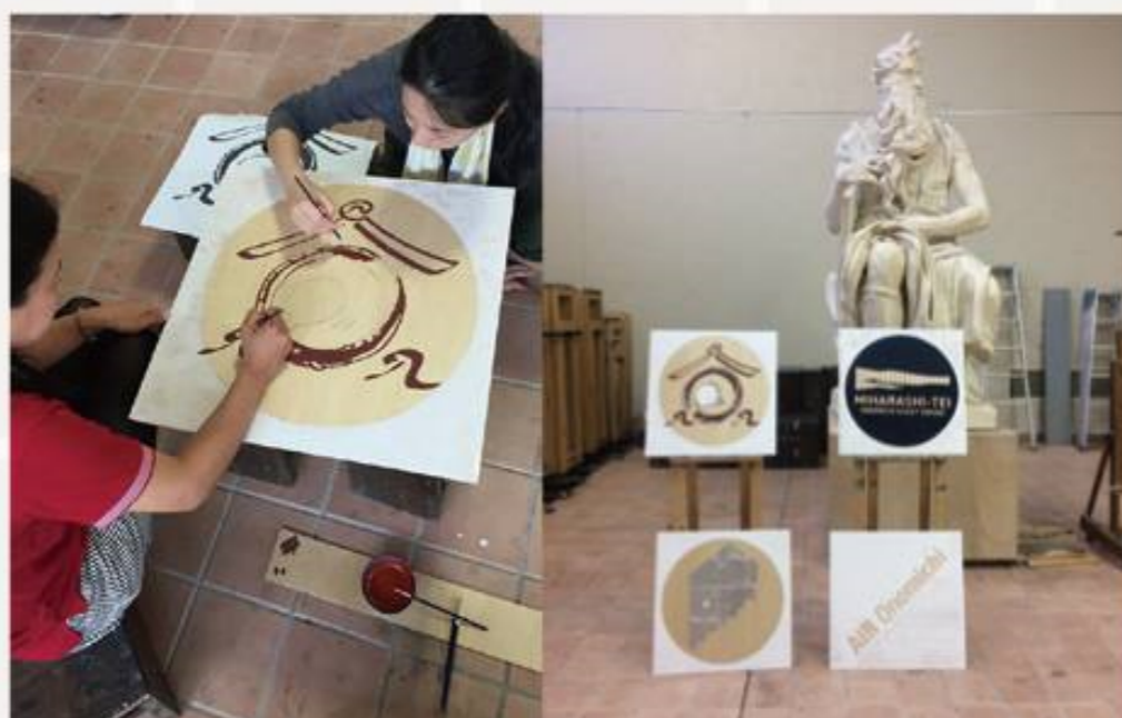
60センチ角の広告を日本画で制作 尾道市立大学日本画の学生さんの協力